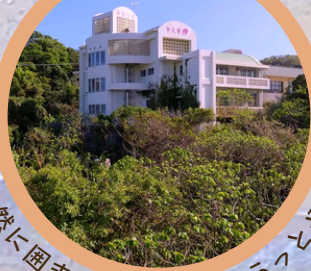
大自然に囲まれた隠れ宿・ぷらっとやえせ

持続可能な漁業のために今できること。 沖縄の海を知り尽くす海人との協働プロジェクト♪