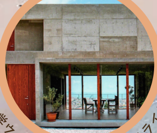
琉球大学ウェルネス研究分野・サテライト南城