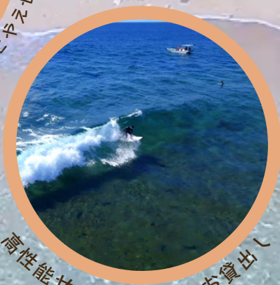
高性能サーフボードをお貸出し