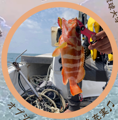
オプションメニューも充実♪